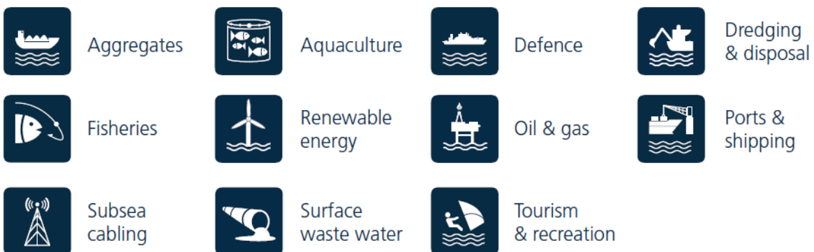
Ffigur 2: Sectorau a gwmpesir gan Gynllun Morol Cenedlaethol Cymru