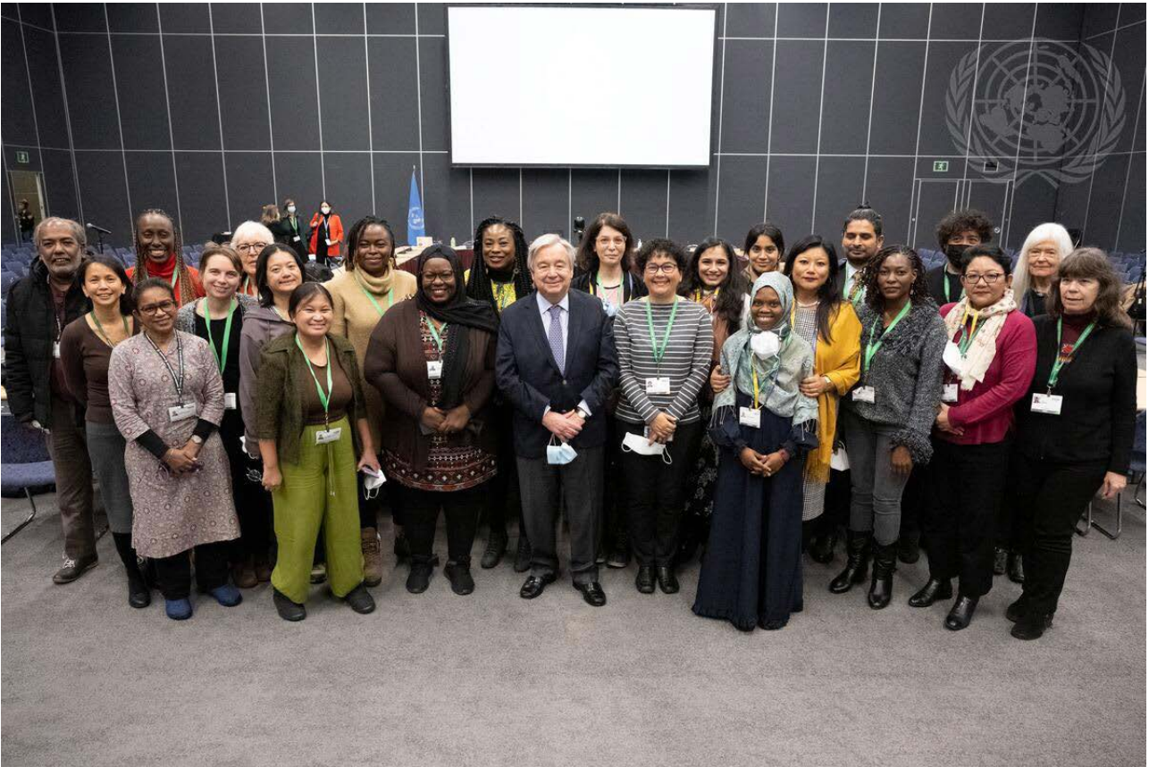
Ffigur 3: Ysgrifennydd Cyffredinol António Guterres gyda chyfranogwyr yn ystod COP15 ym Montreal, Canada